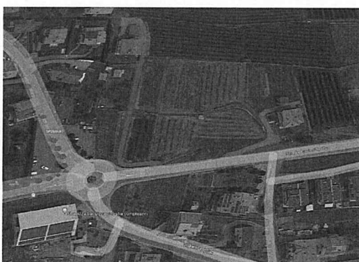
Fig. 3 Ortofoto 2021